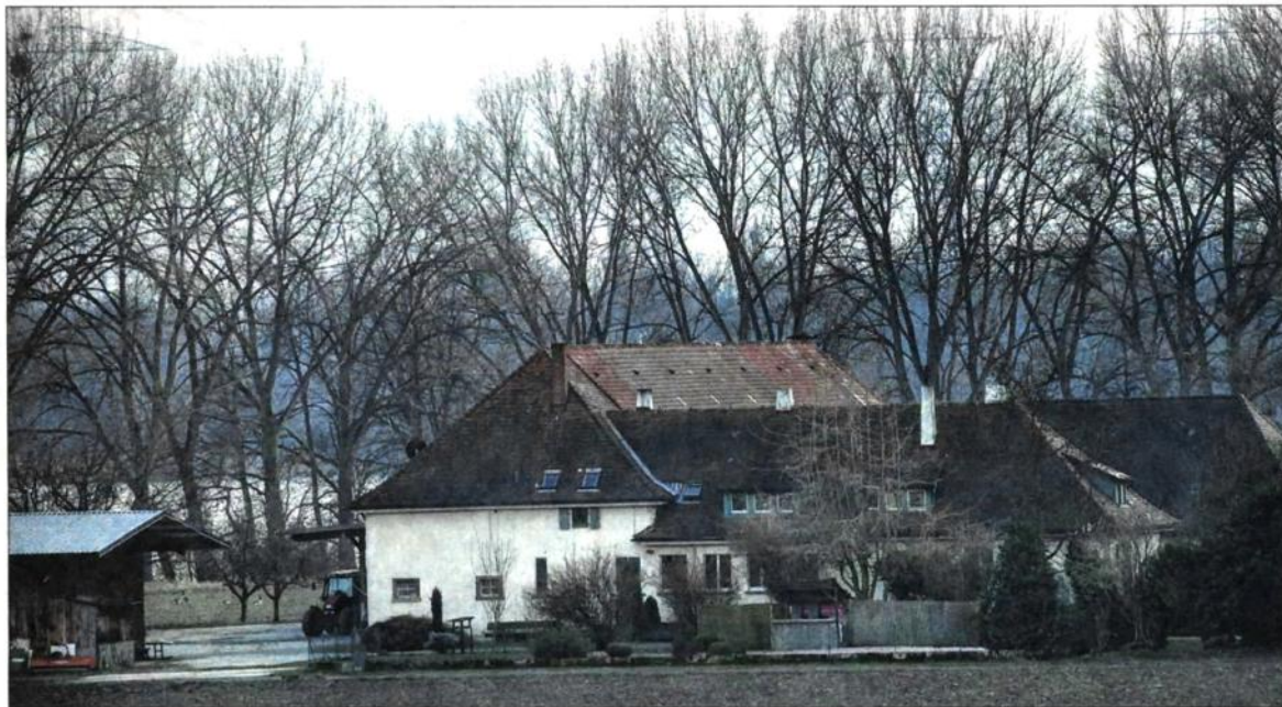
DAS HOGGUT MAXAU soll zu einem Anziehungspunkt für Familien werden. Die Stadt wünscht sich vom neuen Pächter, dass er den landwirtschaftlichen Hof bewirtschaftet und das Gasthaus als Zuerwerb betreibt. Zudem soll er pädagogische Aufgaben übernehmen.